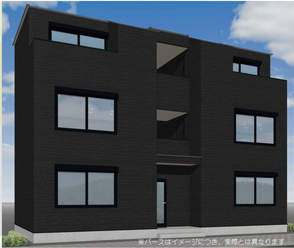
※パースはイメージにつき、実際とは異なります