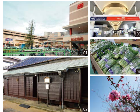
01:ショッピングモールが立ち並ぶ駅前 02:「八潮市立資料館」で古民家探索も 03:TX「八潮駅」 04:新鮮野菜を扱うなら「八潮市ふれあい農産物直売所」 05:四季折々の花が楽しめる「中川やしおフラワーパーク」

2024年から快速停車駅となった、つくばエクスプレス「八潮駅」。駅前には「フレスポ八潮」「BiVi八潮」と商業施設が並んでいます。便利なお祭りなどイベントも多い楽しい街です。休日には「つくば方面」を訪ねてみるのもアリかも!