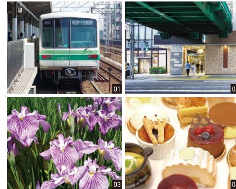
01:「北綾瀬駅」は千代田線の始発 02:駅直結のペーカリー「リトルマーメイド」イートインもOK 03:駅前「しょうぶ沼公園」色とりどりのハナショウブが美しい 04:スイーツは地元の名店「パティスリーアンプリル」

都心へのアクセス良好、始発駅で通勤通学は快適! 駅直結の大型商業施設もオープン予定で、さらに便利に。街なかには激安ショップも点在し、買い物には困りません! 駅前「しょうぶ沼公園」ほか、ひと息つける場所もたくさんあります。