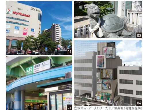
01:駅南口から徒歩約5分の大型ショッピングモール「アリオ亀有」 02:JR常磐線「亀有駅」 03:「亀有香取神社」では「狛亀」がお出迎え 04:2025年オープンの「こち亀記念館」漫画の世界が実際に楽しめます! ©秋本治・アトリエビーだま/集英社(高橋区提供)

多彩なお店が軒を連ねて、歩くだけでも楽しい7つ(南口側4・北口側3)の地元商店街。大型商業施設(「リリオ亀有」「アリオ亀有」)もあり、便利です。「こち亀」*ゆかりのスポット巡りもおススメ! *「こち亀」舞台が聖地巡りもアリかも!