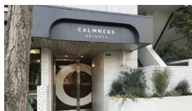
北綾瀬駅から徒歩3分の優良物件