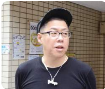
「たくさんの人に銭湯を知ってほしい」と語るオーナー様

滑り止めの効果は裸足で歩いて実感しました これからは不動産投資もやってみたいですね