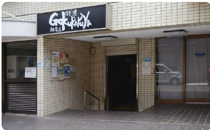
マンション1階にある店舗は印象的な店名ロゴが目印

滑り止めの効果は裸足で歩いて実感しました これからは不動産投資もやってみたいですね