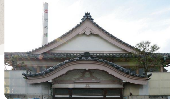
築50年以上、見事な破風造りの「竹の湯」

かなり強いらしい。補修が終わったら、いろいろな人から「煙突が目立つようになったね」といわれたけど(笑)。