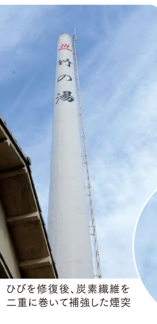
ひびを修復後、炭素繊維を二重に巻いて補強した煙突