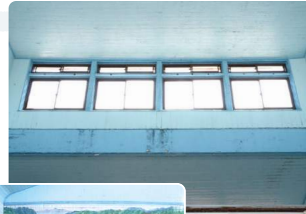
高い天井(上)と浴槽に滝が流れ込むような背景画(左)が印象的

親父からここを継いだ昭和60年頃は練馬区内で55軒くらい風呂屋があったけれど、今は23軒しかない。この辺で内風呂