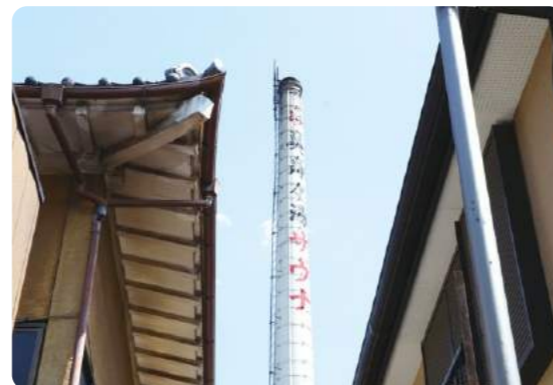
築50年を超えた今でも地元で親しまれている銭湯