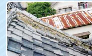
アミックスで耐震化工事を行った 浴場屋根(施工前)

*計画的修繕とは、専門家(建築士など)の診断を受けて行う、躯体に関わる工事です。 *対象工事費の限度額を超えた部分は自己負担になります。