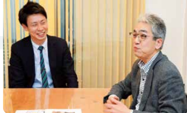
浴場組合でも付き合いは長く「母も私もアミックスさんは信頼しています」

もともと、ここは駅から遠いので賃貸には向かないと思っていました。コンビニは長期契約だし、その後うちが断らなければ続けるという条件なので、とりあえずは安心ですね。