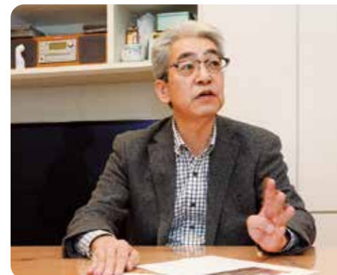
先代が病気になって会社を退職、家業を継がれた椎橋様「転勤話もあって、両親を置いて行くことはできなかったですね」

アミックスさんには更地にして舗装までお願いして、とりあえずコインパーキングにしました。そのあとコンビニにしたのは、いろいろな会社さんのお話を聞いて、この場所でも需要があると思ったから。