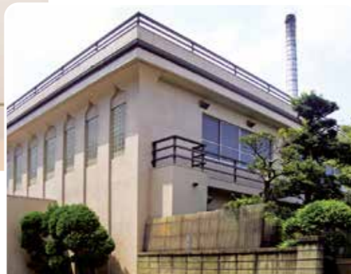
趣のある窓のデザインが特徴的だった浴場