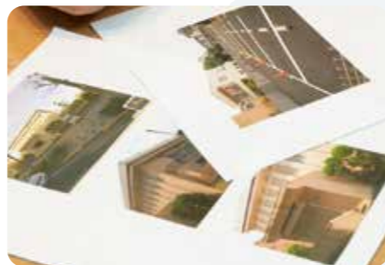
昭和43年、首都高建設にともない建て替えとなったRC造の「椎橋湯」