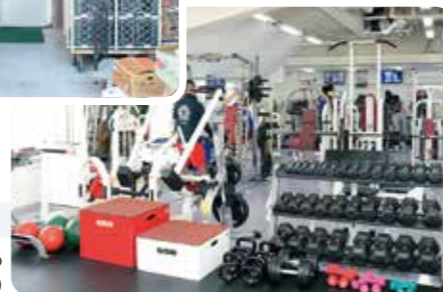
加圧トレーニングも人気のジム(2階)

早めました。シャワーしかないジムなので、トレーニングのあとに来てくれる人もいてお客さんが増えました。全体的に来店時間が分散されたのもよかったですね。