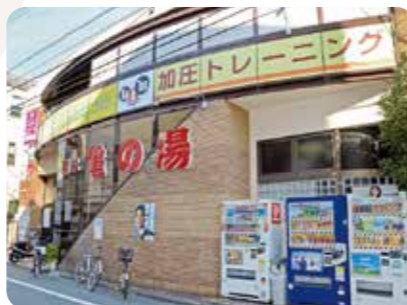
創業は昭和32年、先代からの引き継ぎを機に木造から建て替えられたビル型の銭湯

もともと1階にサウナと銭湯、2階には休憩所やマッサージ室、食事も提供する大広間がありました。健康ランドのはしりみたいな感じですね。でも時代の流れでサウナのお客さんが減ってからは、2階は休憩所だけになっていました。もったいないし、設備も老朽化していたので銭湯だけ残して、あとはテナントに貸すことにしました。