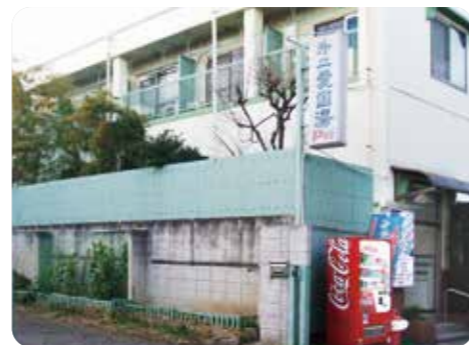
本店より暖簾分けして34年前にはじめた 第二愛国湯(浴場の上は貸室4戸)

アパートにしたのは、土地を売りにたくなかったから。 遠いのであまり見に行けないけど、心配はないですね。