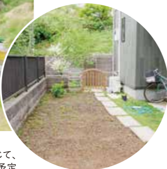
ゴルフ好きが高じて、この場所にはグリーンを造成予定