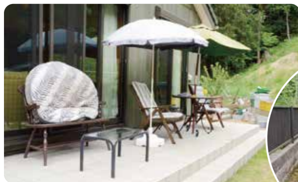
大勢が集まってBBQも楽しめる広いテラス

ここ(青梅市のご自宅)は完成したアパートとは遠いので、何かあってもすぐ行けないことが不安でした。でもサブリースでおまかせしているんで、実際は何の心配もなかった。今は、兄弟とか親戚がよく集まってバーベキューをやったりして楽しいですよ。この辺はゴルフのコースも多いし(笑)。