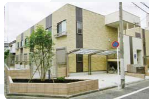
2015年完成のアパート「ソレイユA・B」 亀有駅から徒歩10分と好立地