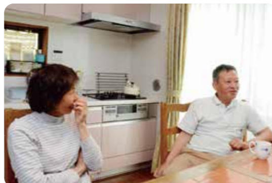
奥様ご実家の土地に自宅を新築、浴場営業終了にあわせて移転されたご夫妻