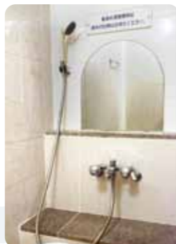
銭湯では珍しい「髪染め優先カラン」も設置