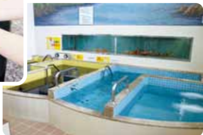
浴場は6年前に大規模改修