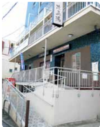
足の悪いお客様でも来られるよう、入口の階段はスロープに改修