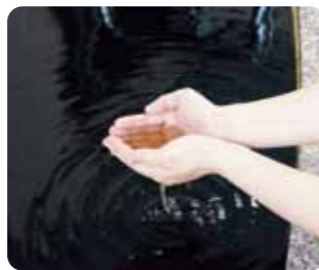
温泉めぐりでも人気の「黒湯炭酸泉」