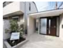
キーレスオートロック