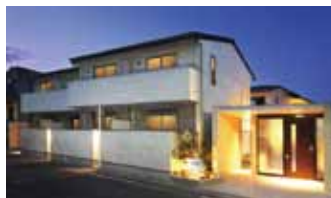
光のぬくもりが帰る人を迎え入れる