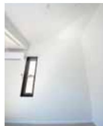
空間を感じる勾配天井