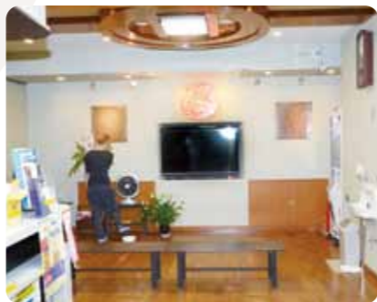
イベントも行われる広い休憩スペース