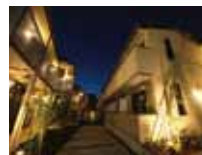
ライトアップされた中庭