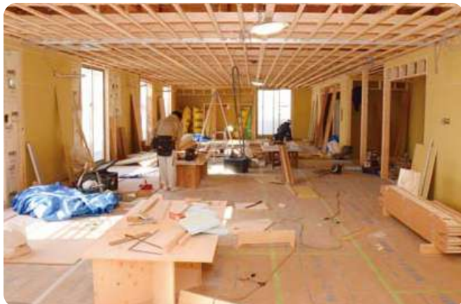
壁ができる前の骨組み状態では、大工さんと並行して電気屋さんも工事中