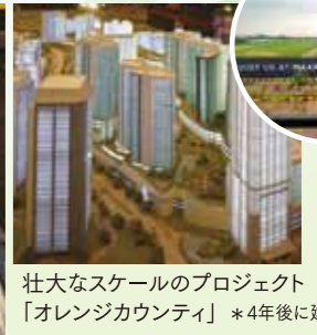
壮大なスケールのプロジェクト 「オレンジカウンティ」*4年後に建物完成予定