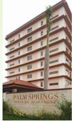
パームスプリングス サービスアパートメント

また、同じインドネシアで、三菱商事も参画するプロジェクトにも投資しています。経済成長にとまない、今後の不動産価格や家賃の上昇が期待されます。アミックスでは、小口の投資(1,000万円~)も承っておりますので、ご興味のある方はお問い合わせください。