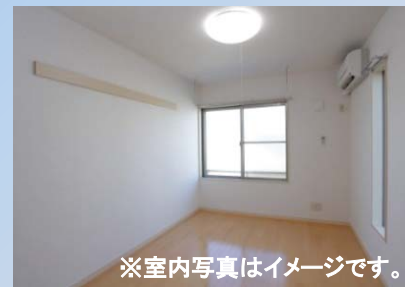
※室内写真はイメージです。