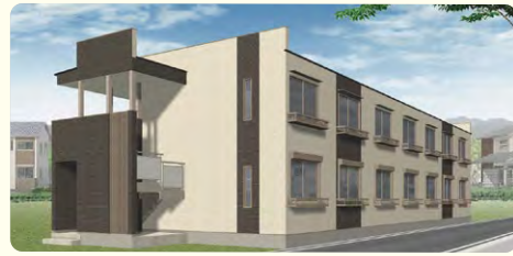
●オートロック完備の安心セキュリティ