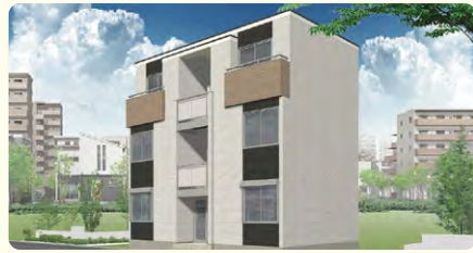
●瑞江駅徒歩3分の好立地 ●オートロック完備