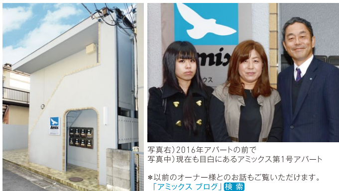
写真右)2016年アパートの前で 写真中)現在も目白にあるアミックス第1号アパート

創立65年を期に、感謝状をお渡しする機会をいただきました。ところが、前回お会いした5年前にはいなかった赤ちゃんも同席です!! アミックスも歴史を重ね、どうやら、四世代にわたる長いお付き合いになってきたようです。