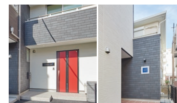
左:オフィス入口 右:アパートエントランス

1階が施主様のオフィスの場合、上階を賃貸にして家賃収入を確保できます。将来的には1階部分を賃貸にすることも可能です。