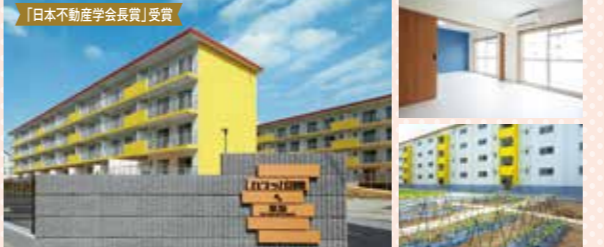
閉鎖されていた古い団地の利活用が評価され、日本不動産学会 業績賞「学会賞」を受賞、テレビ放映のほか新聞などメディアでの掲載も多数