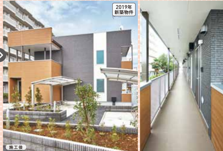
2019年新築物件 1棟18戸(カラーアズHシリーズ)

施工からサブリース管理まで、 責任をもって自社で請け負う 一貫した体制が、高い評価につながりました!