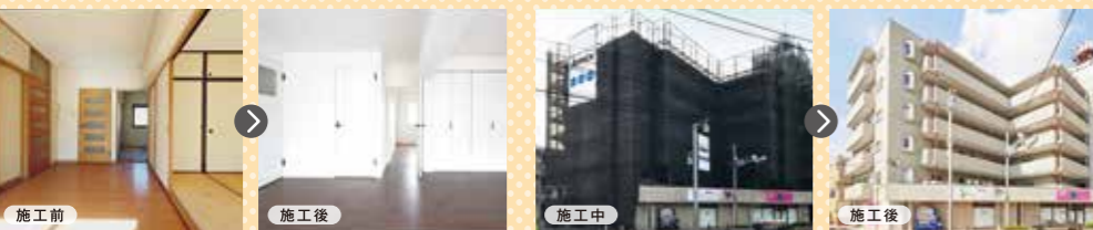
古い和室をフローリングに、仕切りも外し広いLDKへと変更 タイルを洗浄、防水シートの貼り替えや鉄部の補修で資産価値を向上