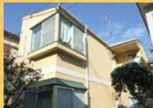
計画・設計 入居者立ち退きサポート