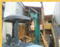
解体 (2019 02)