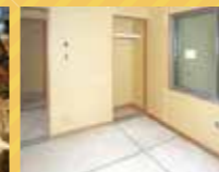
竣工 (2019 08)