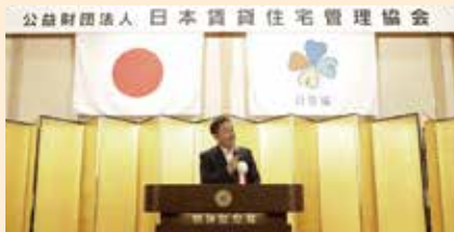
過去最多の参加者が集まった総会

健全で専門的な賃貸運営・管理を通じて、豊かな国民生活の実現に寄与することを目的として設立された国土交通省所管の団体。現在、北海道から沖縄まで全国で14ブロックの支部をもち、年々会員数も増加しています。