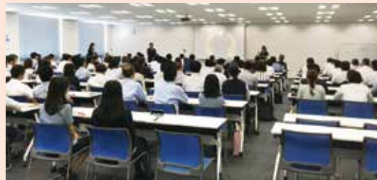
社員表彰も行われた発表会

期初を迎え、第63期経営方針発表会を開催しました。今期も目標達成に向け、全社一体となって取り組んでまいります。