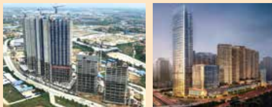
学校やショッピングモールなども建築、誘致の予定(左:現在 右:完成予想図)

2016年、アミックスも出資をし、三光ソフラングループで建築前の分譲マンションを購入しました。オフィス・住宅・商業施設・学校・病院などの都市機能を充実させ、居住人口7.2万人、昼間人口15万人が集う都市を新たに創造するプロジェクトへの投資です。隣のビルを三菱商事が購入したことから、「将来性のある海外投資先」ということがわかります。