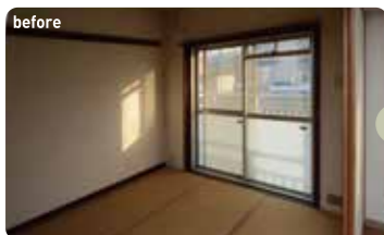
古い団地の間取りを一新した居室