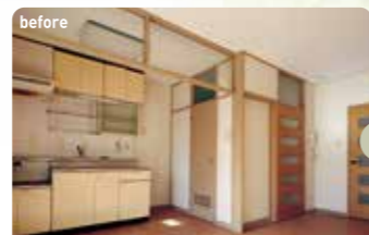
シックなデザインのキッチン