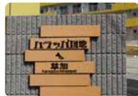
団地入り口の可愛いロゴ

地域貢献にもつながる保育園や 人の集うカフェ “新しく、あたたかく、 どこか懐かしい”コミュニティ